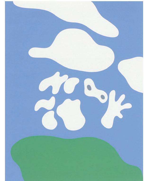
Ohne Titel | Hans Arp | 1959 | Arp Museum Bahnhof Rolandseck