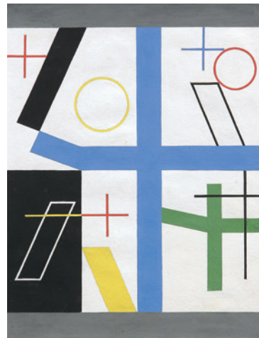
Quatre espaces à croix brisée Sophie Taeuber-Arp | 1932 | Arp Museum Bahnhof Rolandseck | Foto: Mick Vincenz