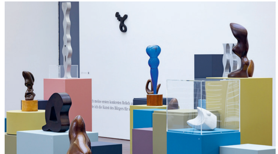
Blick in die Ausstellung Unwesen und Treiben | 2022